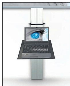
→ Acc.: p. 52